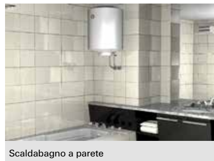
Scaldabagno a parete