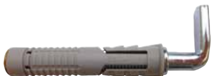
Fissaggio per scaldabagno PFS