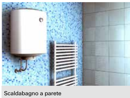
Scaldabagno a parete